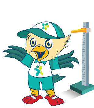
TRANSFORMASI LAYANAN PRIMER

Sejalan dengan visi Presiden untuk mewujudkan masyarakat yang sehat, produktif, mandiri dan berkeadilan