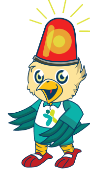
TRANSFORMASI LAYANAN RUJUKAN